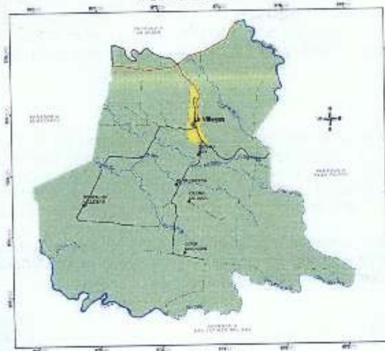
Figura 1. Mapa base